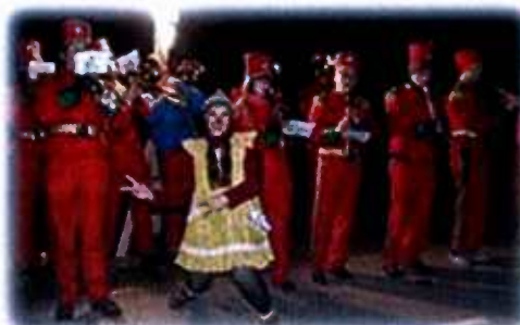
Tek božičkov je tokrat spremljal Pihalni orkester Vevče.